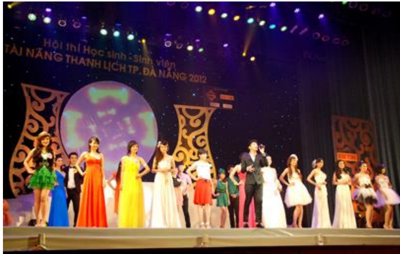
Các thí sinh tham dự trong đêm chung kết Học sinh - sinh viên Tài năng Thanh lịch