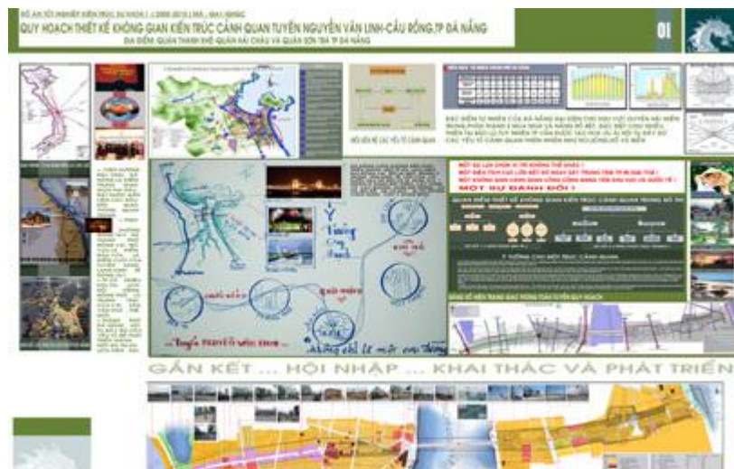
Bảng quy hoạch thiết kế không gian kiến trúc cảnh quan tuyến Nguyễn Văn Linh-Cầu Rồng