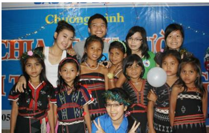
Chương trình văn nghệ với các bạn thiếu nhi

rút chuẩn bị quà tặng. Những cuốn tập, những cây bút lại được gửi trao đến các em. Những túi gạo nhỏ được sẻ chia cho đồng bào, của ít lòng nhiều. Thiếu nhi vui vì có vở mới, bút mới chuẩn bị cho năm học mới. Đồng bào ấm lòng vì có thêm đôi bữa cơm trắng dẻo chứa đầy tình thương từ sinh viên thành phố. Sau tặng quà là văn nghệ. Với các em, với đồng bào còn gì vui hơn là được xem văn nghệ. Dưới ánh sáng rực rỡ, âm thanh rộn ràng của sân khấu “đã chiến” những tiết mục được chuẩn bị kĩ lưỡng của sinh viên, những tiết mục mới tập của thiếu nhi và cả những tiết mục ngẫu hứng từ phía thanh niên lần lượt được trình diễn. Tất cả như hòa làm một trong bầu khí của tuổi trẻ, của nhiệt huyết và của tình yêu thương. Người diễn có khi là khán giả, rồi chính khán giả lại trở thành người diễn. Tươi vui và rộn ràng. Hát hết mình, múa hết mình và nhảy cũng hết mình. Bản nhò đêm nay thức khuya hơn, lửa lại được nổi lên. Đến giờ của thanh niên và sinh viên. Thanh niên cầm tay sinh viên nhảy điệu xap truyền thống của đồng bào miền núi. Khoảng sân nhỏ giữa ủy ban trở thành sân khấu. Từng đôi, từng đôi diu nhau nhảy hết dàn sạp. “Thanh niên ở lại cố gắng làm việc để xây dựng bản làng nhé, sinh viên về thành phố học tốt nhé” -những lời thì thầm của đôi bạn chưa kịp biết tên nhau còn vang vọng khi ngọn lửa đã tàn.