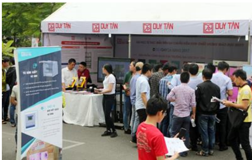
Gian hàng giới thiệu sản phẩm của Đại học Duy Tân luôn chật kín khách tham quan

Bên ngoài Hội nghị là hoạt động triển lãm được rất nhiều các đơn vị, doanh nghiệp làm việc trong lĩnh vực công nghệ quan tâm tham gia để giới thiệu sản phẩm. Trong đó có các thương hiệu hàng đầu như HSBC, Global Cyber Soft, DNES, Gamelot, Aglity... Đại học Duy Tân đã giới thiệu 10 sản phẩm gồm: Tủ trồng rau thông minh Veggreen - Giải Nhì Cuộc thi Microsoft Imagine Cup 2017 tại Việt Nam, Loa đa năng, Thiết bị báo hết giấy vệ sinh, Tủ bán giấy vệ sinh, Máy lấy số thứ tự xếp hàng không dây, Robot kiểm tra khuyết tật mỗi hàn vỏ tàu, Máy cấp phiếu giữ xe cầm tay, Bộ truyền tin phục vụ giáo dục, Tủ bán Bao cao su tự động, Tủ cấp phát Bao cao su miễn phí (đã được đặt tại phường Hòa Hiệp Nam và Trung tâm y tế phường Hòa Khánh Nam thuộc quận Liên Chiểu, Tp. Đà Nẵng).