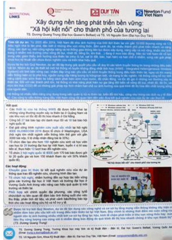
Bảng tóm tắt dự án Xây dựng nền tảng phát triển bền vững: ‘Xã hội kết nối’ cho thành phố của tương lai

Đối với các thành phố lớn, hệ thống có khả năng phát hiện sự gia tăng đột biến về nồng độ bụi, nhiệt độ, độ ồn và mức khí thải (CO2) để có những giải pháp kịp thời nhằm hạn chế sự ảnh hưởng của quá trình đô thị hóa đến chất lượng sống.