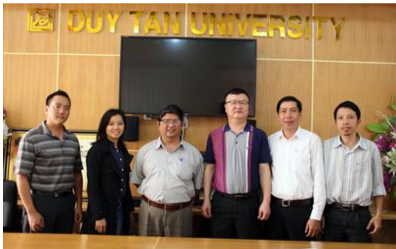
Hai bên cùng chụp hình lưu niệm trong buổi Ký kết

Cũng tại buổi Ký kết, hai bên đã trao đổi nhiều nội dung trong Hội nghị Quốc tế về lĩnh vực Công nghệ Thông tin do KIICE tổ chức tại Tp. Đà Nẵng vào tháng 6/2016. Nhận định Đại học Duy Tân là một trong những đối tác tiềm năng và là đơn vị đã tổ chức thành công nhiều Hội nghị Quốc tế, KIICE rất tin tưởng vào sự hỗ trợ của Duy Tân trong Hội nghị lần này. Các chuyên gia và nhà nghiên cứu của Đại học Duy Tân cũng sẽ gửi những bài tham luận tham dự Hội nghị, góp phần làm sáng tỏ nhiều vấn đề đang được xã hội quan tâm trong lĩnh vực Công nghệ Thông tin.